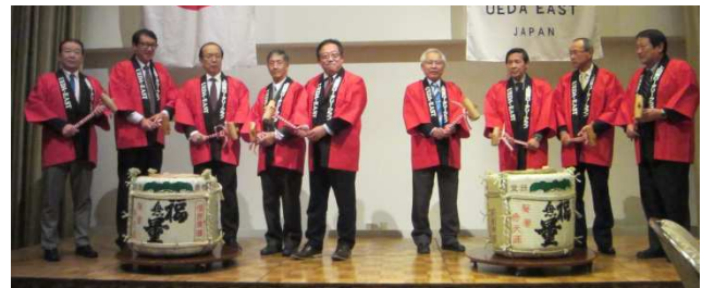
R12600地区 東信第二グループ 新春合同夜間例会

本日の新春合同夜間例会を企画された上田東RCに感謝し、参加されたロータリアンにとって楽しい親睦の場となることを期待して挨拶と致します。