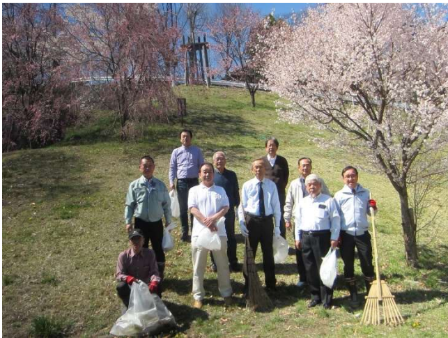
作業が終わって集合写真