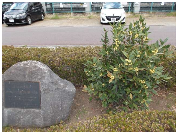
ポールハリス 4 世 月桂樹も開花 4/25