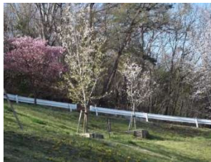
20 周年のオオシマ桜開花 4/28