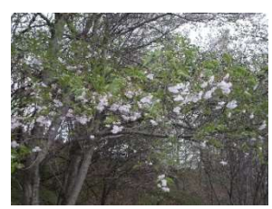
5 周年東側土手の桜開花 4/28