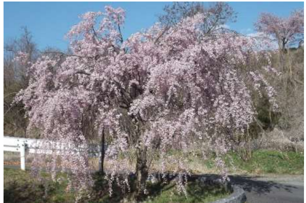
5 周年記念のしだれ桜満開 4/22