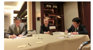
楽しい語らいが続きます