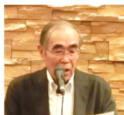
上田 RC 様、上田東 RC 様よりニコニコBOXをいただきました。