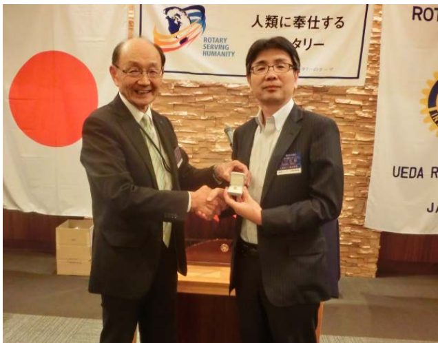
今年度会長より次年度会長へバッジを