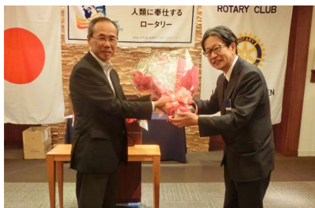
次年度幹事より今年度幹事へ花束を