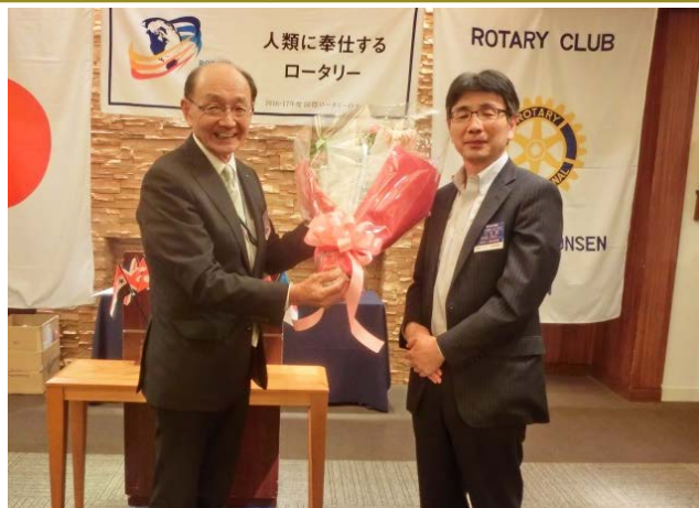
次年度会長より今年度会長へ花束を