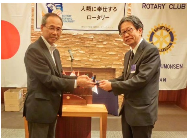
今年度幹事より次年度幹事へバッジを