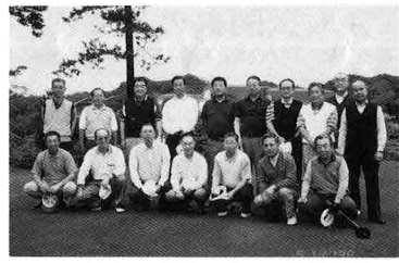
第7回ゴルフコンペ

「66期」卒業三十周年を迎え、慣例となっている母校への記念品の贈呈を計画中です。同期会は卒業後二十五年を過ぎ、気運も高まり隔年に開催しています。会場は三十年前に戻った若人の笑顔に包まれます。また、有志の集いとして、66会ゴルフコンペや、毎月の例会なども催しています。今秋は卒業三十周年として、同期会を盛大に行いたいと準備中です。大勢の参加をお願いします。