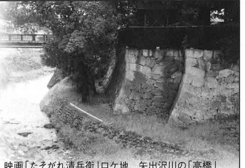
映画「たそがれ清兵衛」ロケ地 矢出沢川の「高橋」