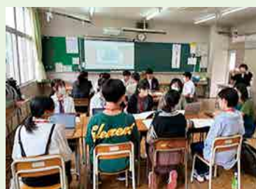
いくことで、地球のより良い未来へとつながっていくことだろう。次代を担う高校生に大いに期待したい。