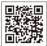
長野県立上田高等学校 いざ百難に試みむ 校歌 ver