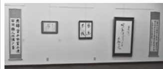
松尾が丘書展として第30回展を迎える。書道班の支援も微力ながら行つて、現役生との交流もはか