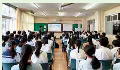
オンラインでの基調講演