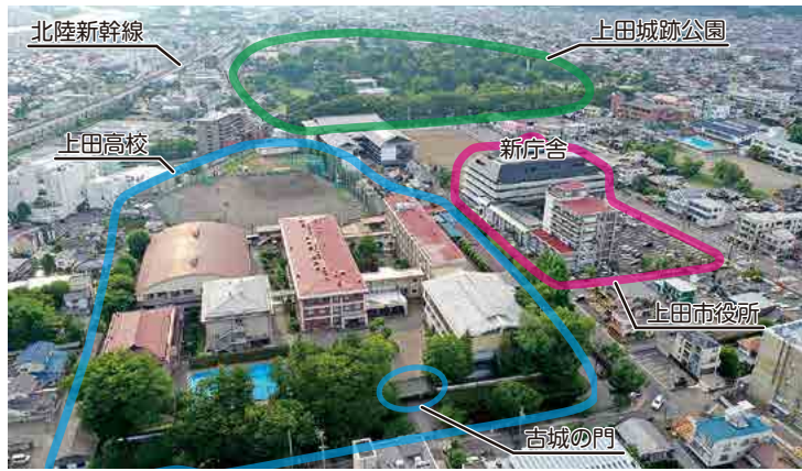
上田高校上空から周辺を望む