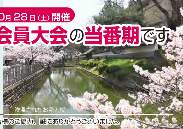
浚渫されたお濠と桜

※120周年記念事業寄付金 80期は目標額に到達しました! 皆様のご協力、誠にありがとうございました。